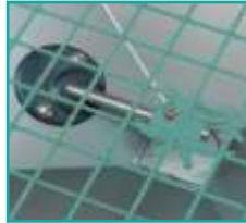
Griglie filtranti standard ed agitatore a rotazione ultra lenta Standard filtering grids with an ultra-slow rotating agitator