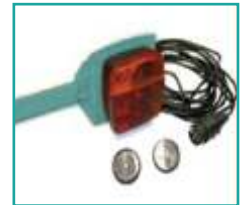
Luci posteriori Tail lights