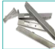
Palette per la diffusione ino a 36 m Vanes for spreading up to 36m