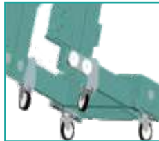
Ruote auto Parking wheels