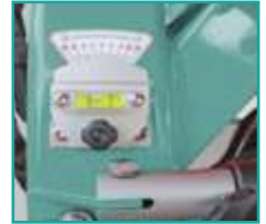
Regolatore di inclinazione per lo spaglio tardivo Tilt regulator for late spreading