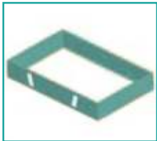
Estensione da 2.000 a 3.000L Extension from 2.000 to 3.000L