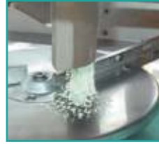
Regolazione ottimale della caduta del concime sul disco spargitore Controlled descent of fertilizer onto spreading disc