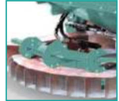
Limitatore mobile A mobile limiter for border edge spreading